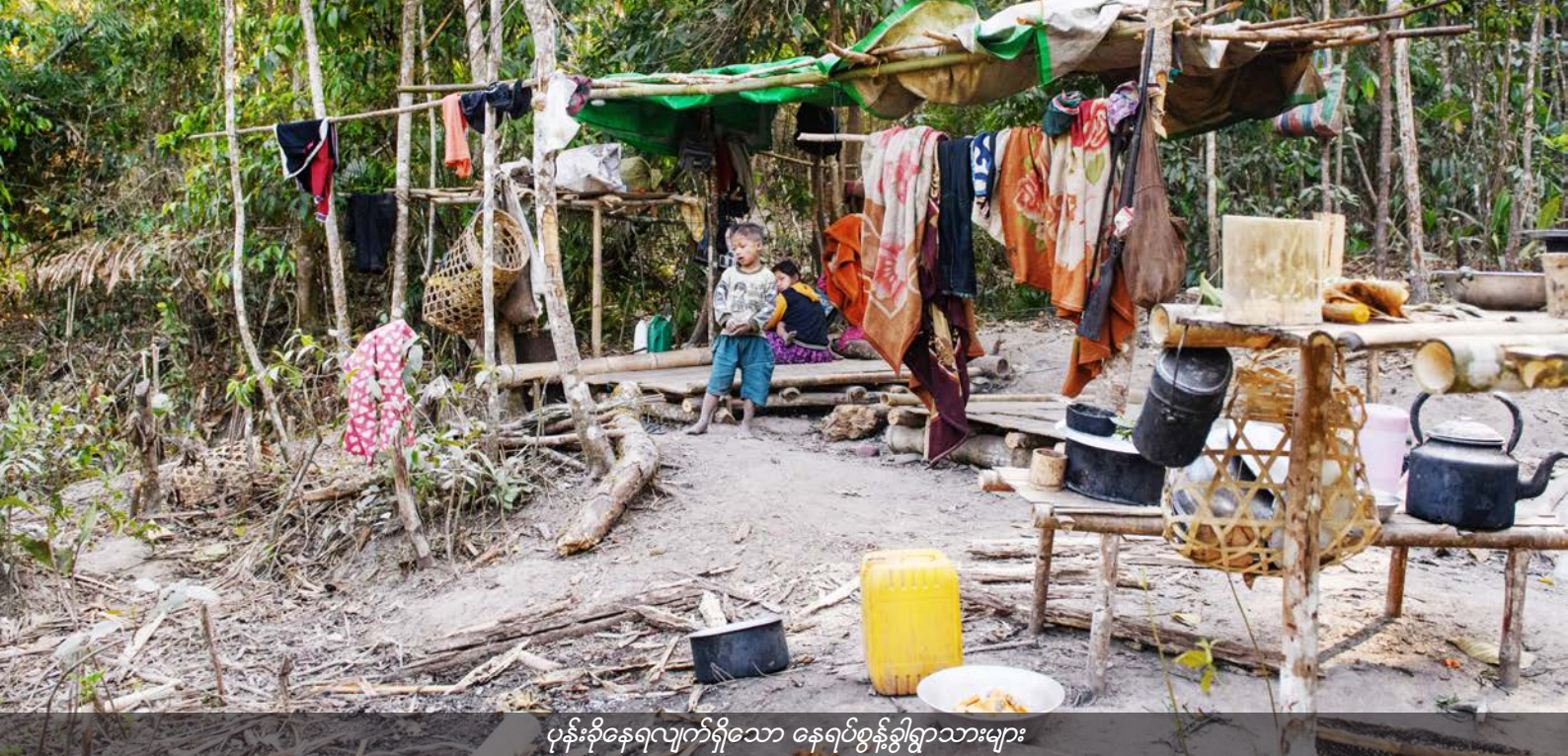
ပုန်းခိုနေရလျက်ရှိသော နေရပ်စွန့်ခွါရွာသားများ