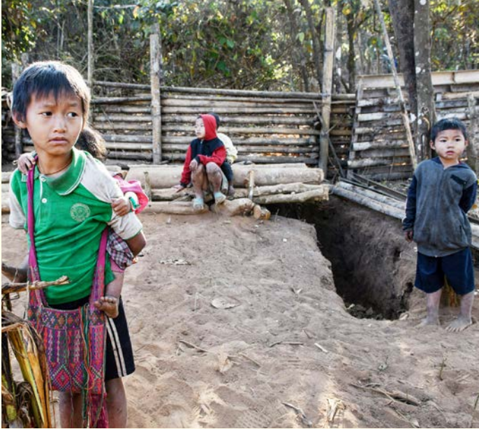
စစ်တပ်၏ အမြောက်ပစ်ခတ်မှုများမှ ကာအကွယ်ရန် ပုံးခိုကျင်းများအား အတင်းအဓမ္မတူးရန် ခိုင်းစေခံရသော ရှာသားများ