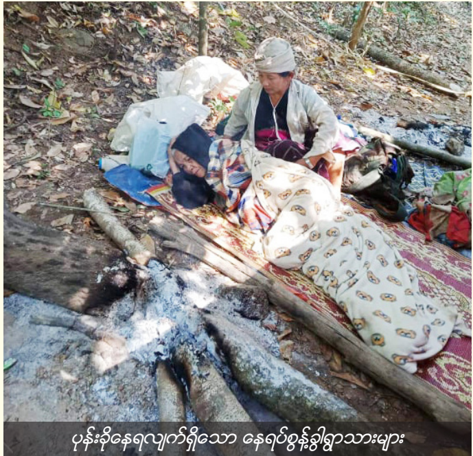
ပုန်းခိုနေရလျက်ရှိသော နေရပ်စွန့်ခွါရွာသားများ